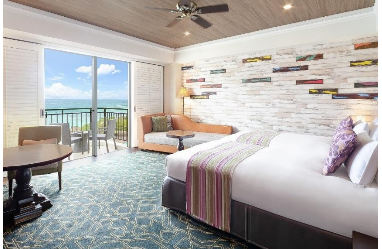
< 客室一例：スーペリアオーシャンパティオツイン >