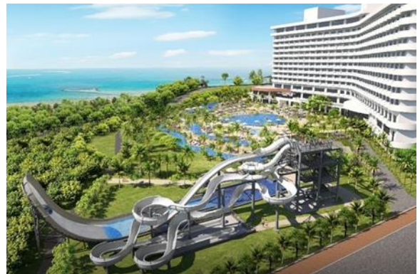
グランドメルキュール沖縄残波岬リゾート